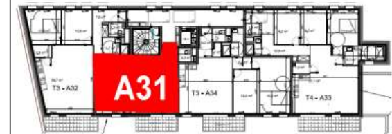
Bâtiment A - R+3