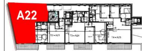
Bâtiment A - R+2