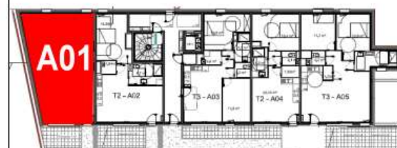
Bâtiment A - RDC