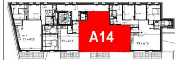
Bâtiment A - R+1