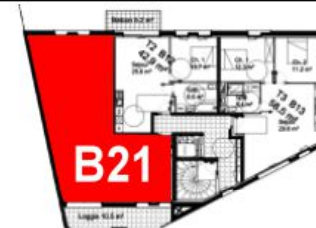
Bâtiment B - R+2