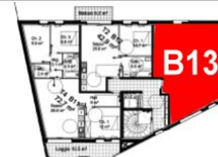
Bâtiment B - R+1