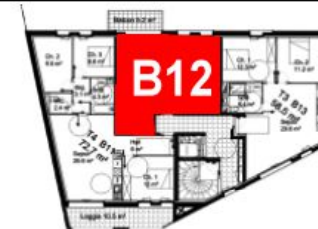
Bâtiment B - R+1