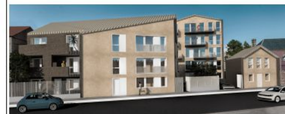
Bâtiment B - Rue Walthere Laurent

Ce plan pourra subir des modifications dues aux impératifs techniques et architecturaux. Etant en état futur d'achèvement, tous les chiffres donnés sont à plus ou moins 5%.