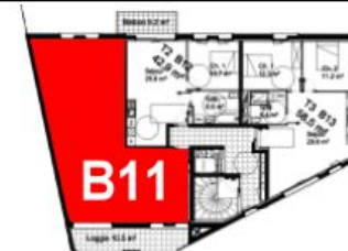
Bâtiment B - R+1