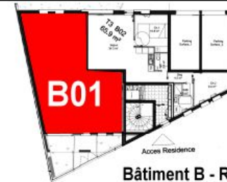
Bâtiment B - RDC