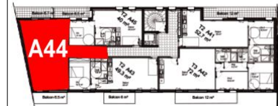
Bâtiment A - R+4