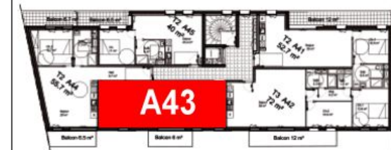
Bâtiment A - R+4