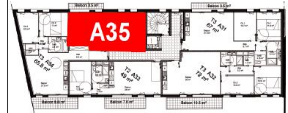
Bâtiment A - R+3