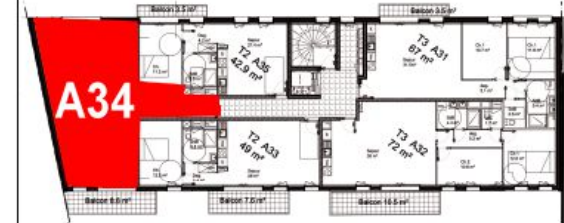
Bâtiment A - R+3