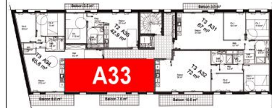
Bâtiment A - R+3