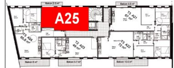
Bâtiment A - R+2