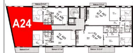
Bâtiment A - R+2