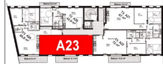
Bâtiment A - R+2