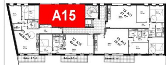
Bâtiment A - R+1