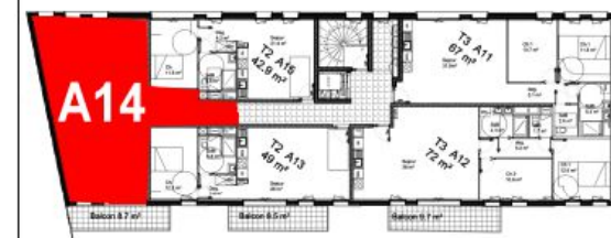
Bâtiment A - R+1